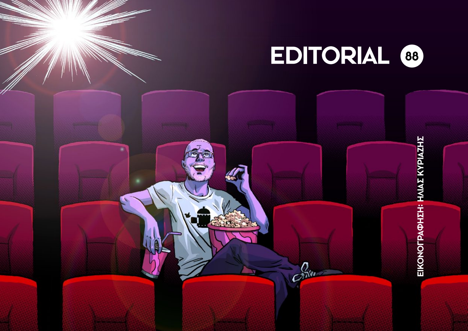
ΕΙΚΟΝΟΓΡΑΦΗΣΗ: ΗΛΙΑΣ ΚΥΡΙΑΖΗΣ