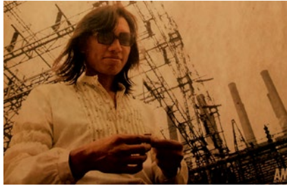
ΨΑΧΝΟΝΤΑΣ ΤΟΝ SUGAR MAN