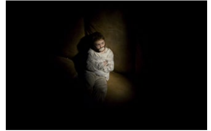
ΜΕΣΑ ΑΠΟ ΤΑ ΜΑΤΙΑ ΤΟΥΣ