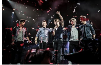
ONE DIRECTION: THIS IS US