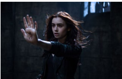
ΘΑΝΑΣΙΜΑ ΕΡΓΑΛΕΙΑ: ΠΟΛΗ ΤΩΝ ΟΣΤΩΝ