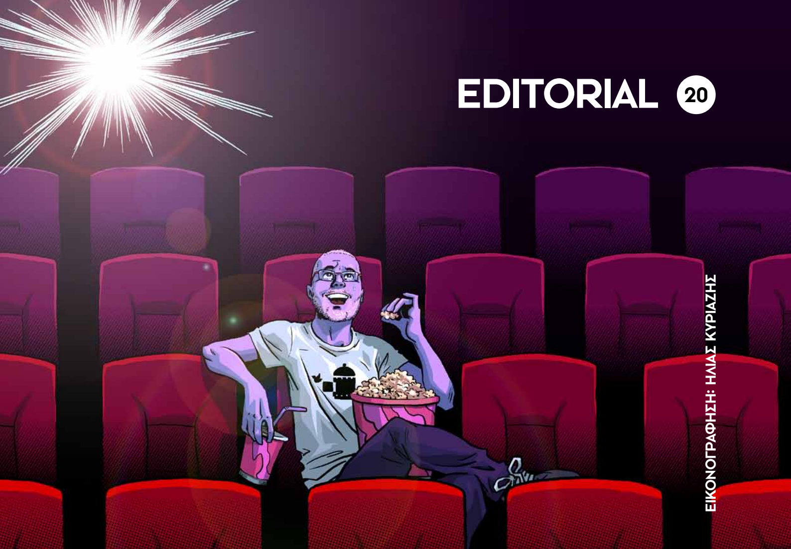
ΕΙΚΟΝΟΓΡΑΦΗΣΗ: ΗΛΙΑΣ ΚΥΡΙΑΖΗΣ

Τ ο σινεμά φταίει... που έγινα κριτικός κινηματογράφου! Δυστυχώς, δεν έχω εγκληματίσει ακόμη! Δε μου βγήκε, τι να κάνουμε; Δεν έβρισκα τα όπλα, δε μου φτάνανε οι αιτίες, δεν προέκυπτε ο... βρασμός ψυχής, για να εκδικηθώ, πάντοτε, μου αρκούσε η φραστική επίθεση. Άχρηστος, σου λέω!